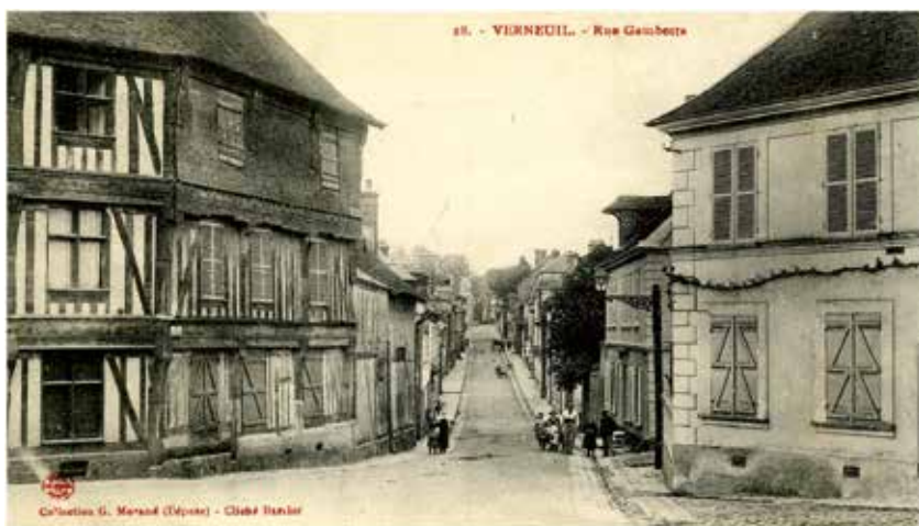
L'ancienne rue Saint-Pierre devenue rue Gambetta qui part de l'actuelle place de Verdun pour rejoindre la rue Porte de Bourth en haut à droite.