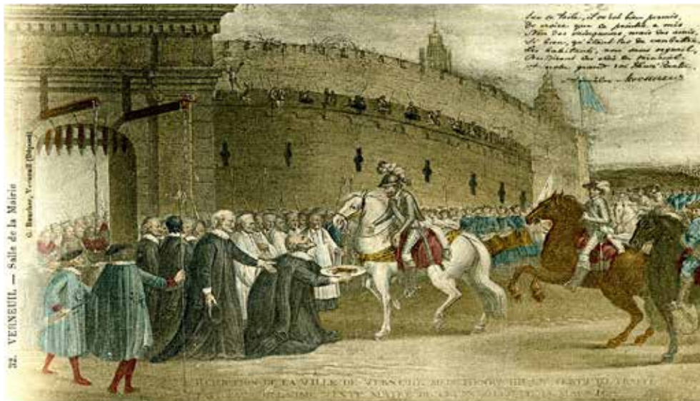
Réduction de la Ville sous Henri IV en vertu du traité fait par Guillaume Vente maire de Verneuil le 25 mars 1594, Hôtel de ville de Verneuil. (Collection Amélie Mesureur d'après le tableau, salle de la Mairie)

Sainte-Anne décorés en fleurs et verdure, l'archivolte et l'entablement, en marbre jaune de Sienne, surmontés d'un aigle les ailes déployées de huit pieds d'envergure, tenant la foudre entre ses serres; les panneaux, entre la corniche et l'archivolte, en marbre blanc veine garnis de deux lions en relief, faisant partie des anciennes armes de la ville. Les frises de l'entablement portant les inscriptions suivantes : d'un côté, Au plus grand des Cézars de l'autre, À Napoléon le Grand, à Marie-Louise, au Roy de Rome, la ville de Verneuil