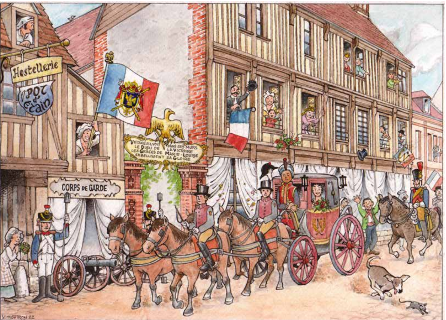
Napoléon 1 er et l'Impératrice Marie-Louise de passage à Verneuil le 22 mai 1811. Rue de La Madeleine devant l'entrée de la mairie. (Collection particulière - dessin de Yves Montron)