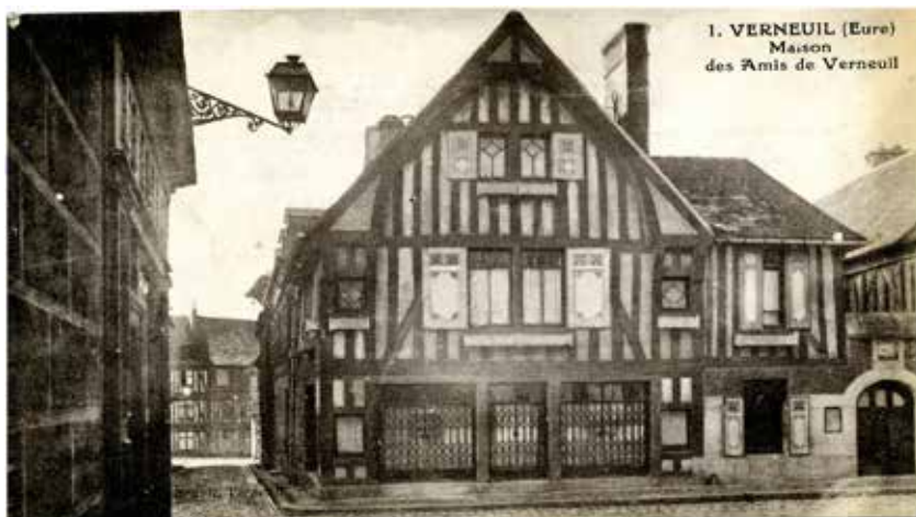
La maison des Amis de Verneuil, rue de La Madeleine À gauche l'étroite petite rue du Buisson-Vert qui va rejoindre la Grande rue Saint-Pierre, aujourd'hui rue Gambetta.