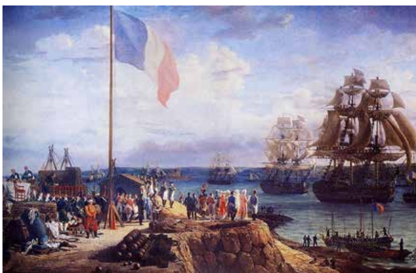
Napoléon et Marie-Louise assistant au défilé de l'escadre de Cherbourg en 1811.

Après avoir relayé à la porte de Bourth, le couple impérial entre dans le département de l'Orne vers midi, dîne au château de Thubeuf, traverse Laigle et Sainte-Gauburge, fait une halte au Haras-du-Pin, passe par Argentan, Occagnes puis Falaise et arrive à Caen, capitale calvadosienne, à 11 heures du soir. Le 25 mai, arrivé dans la Manche, Napoléon visite la ville de Carentan.