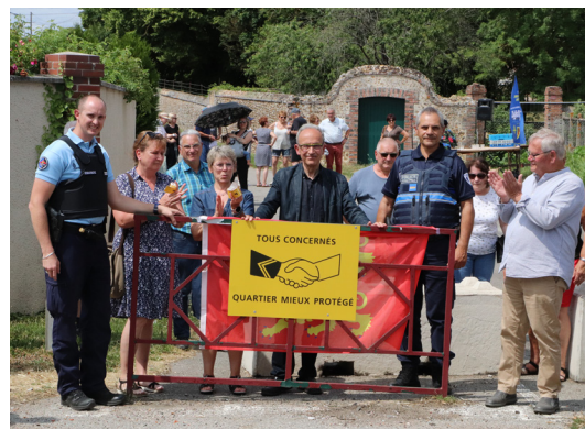
Lancement du dispositif, quartier du Vieux Poëlay, mardi 27 juin

Le parc de caméras qui équipe la commune s'étend d'année en année avec une forte implication de la brigade de gendarmerie tant dans l'implantation que dans l'exploitation des